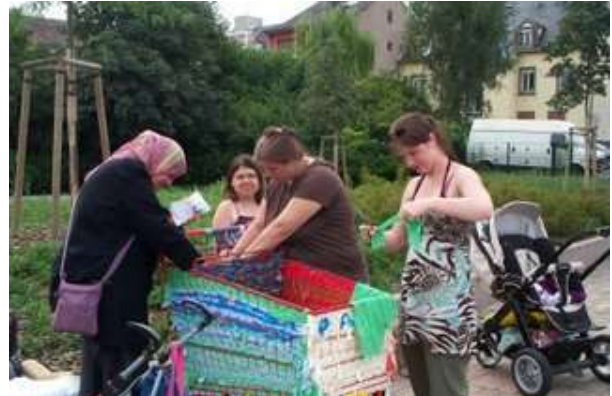
Réalisation du caddie Animation de Rue de l'association