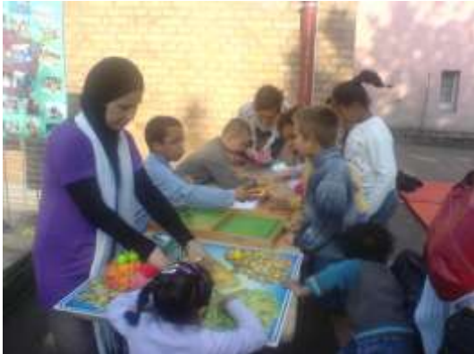
Fête de rentrée

Beaucoup de manifestations, peut être trop ? Pour moi les activités les mieux réussies, sont celles où il y avait le plus de parents impliqués dans l'organisation. Nous allons uniquement travailler sur ce type de manifestation l'année prochaine, car c'est là que l'objet de l'association prend tout son sens. Les manifestations qui nous permettent de discuter et nous faire connaître auprès de nouveaux parents, car les animations sont déjà organisées comme la tournée Arachnima d'été, sont également intéressantes pour nous. Nous laisserons de côté les manifestations qui ne permettent pas aux parents membres de l'association de s'impliquer, car préparées à la hâte ou sans conditions optimales pour permettre leur réelle implication.